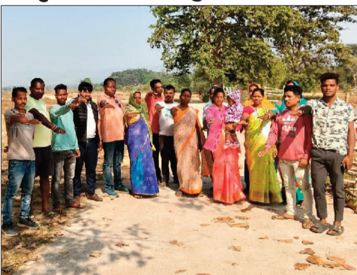
हरिभूमि न्यूज ▶▶ जशपुरनगर

भारतीय लोकतांत्रिक व्यवस्था के तहत संविधान अंगीकृत करने हेतु 26 नवम्बर को जशपुर जिले के सभी अमृत सरोवरों में संविधान दिवस मनाया गया। इस अवसर पर सभी की सहभागिता के साथ सामूहिक तौर पर देश के संविधान की उद्देशिका का वाचन किया गया। साथ ही अलग-अलग स्थानों पर जिला, जनपद एवं ग्राम पंचायत मुख्यालयों में विभिन्न कार्यक्रम आयोजित किए गए।