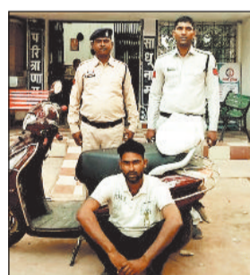
प्लास्टिक थैला के अंदर कच्ची महुआ शराब मिला। इसकी कीमती

चंद्रपुर। चन्द्रपुर टीआई की मेहरून कलर की स्कूटी में एक व्यक्ति हरदी की ओर महुआ शराब को अपने स्कूटी में रखकर परिवहन करने की सूचना मिली।